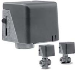
VA-7010 执行器配 VB-5X71 阀门